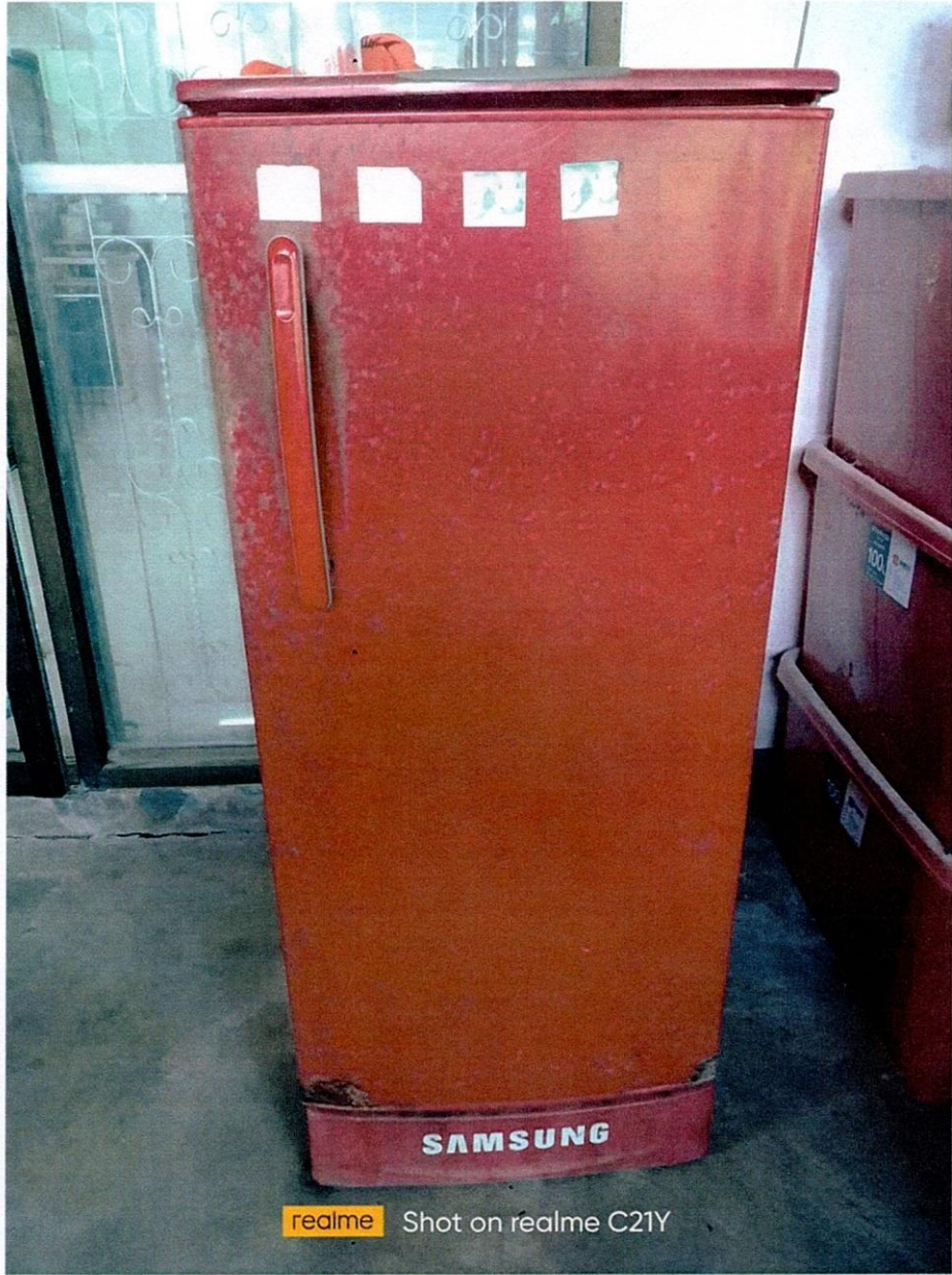
realme Shot on realme C21Y